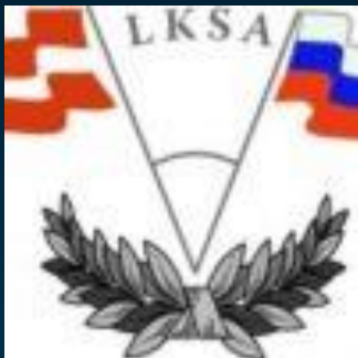
Латвийско-Российская Ассоциация сотрудничества