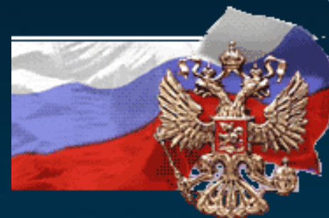
Посольство РФ в Латвии